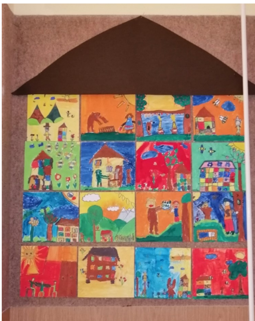
Učenke in učenci 2. in 3. razreda