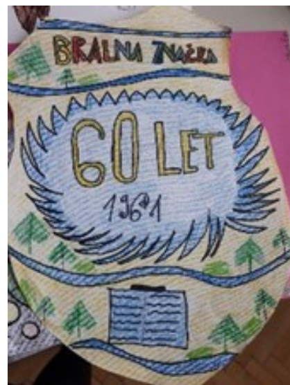
Neja Špenger, 4.a