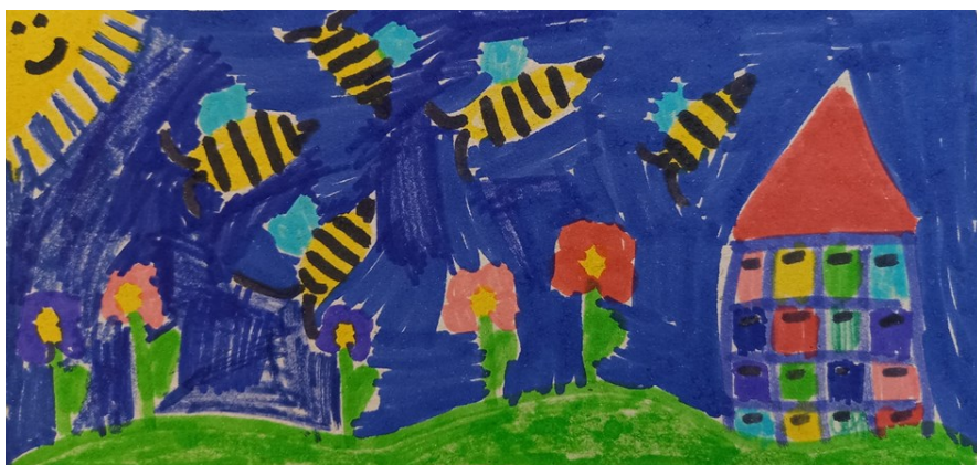
Taja Leskovec Kozel, 1.r