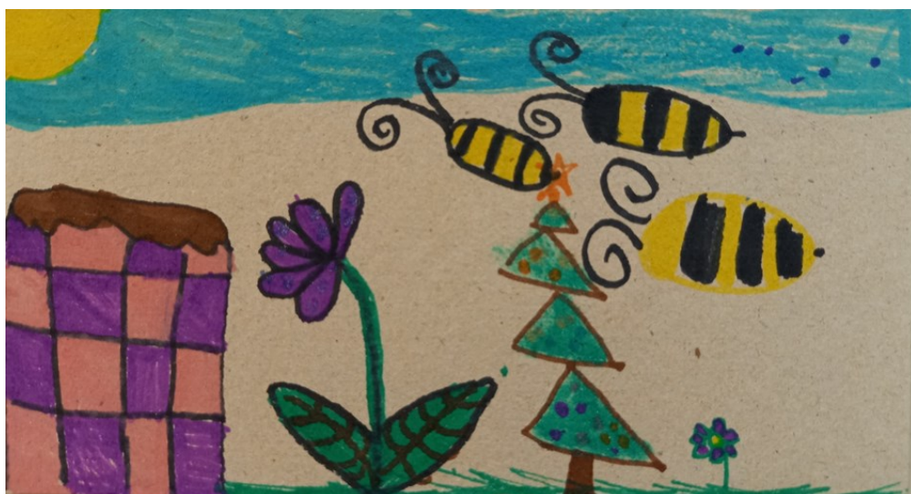
Bella Gerdej, 1.r